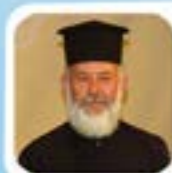
At Gjergji Gjata Kisha Ortodokse Autoqefale e Shqipërisë, Sarandë